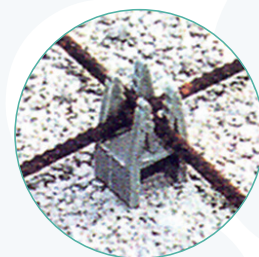
Esempio di utilizzo