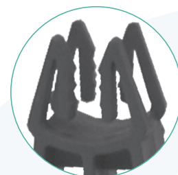
Distanziatore a due forchette