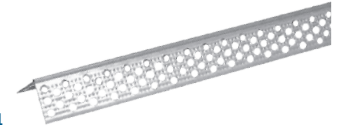
PC30x30-01 Paraspigolo per cartongesso

Importati da GRUPPO STAMPLAST i paraspigoli sono indicati per la protezione e il rinforzo dell'intonaco degli spigoli.