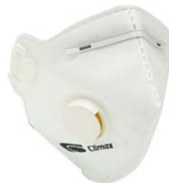
MASCH-06 • TIPO FFP3 • MASSIMO LIVELLO D'USO: 50 x TLV • CON VALVOLA DI ESALAZIONE

TLV: Il valore limite di soglia di una sostanza chimica è un livello al quale si ritiene che un lavoratore possa essere esposto giorno dopo giorno per una vita lavorativa senza effetti negativi per la salute.