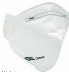
MASCH-04 • TIPO FFP2 • MASSIMO LIVELLO D'USO: 10 x TLV • SENZA VALVOLA DI ESALAZIONE