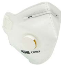
MASCH-05 • TIPO FFP2 • MASSIMO LIVELLO D'USO: 10 x TLV • CON VALVOLA DI ESALAZIONE