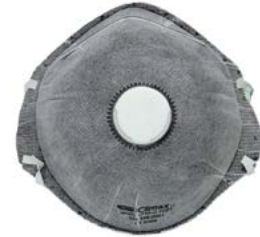
MASCH-02 • TIPO FFP1 • MASSIMO LIVELLO D'USO: 4 x TLV • CON VALVOLA DI ESALAZIONE • CON CARBONE ATTIVO