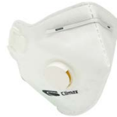
MASCH-03 • TIPO FFP1 • MASSIMO LIVELLO D'USO: 4 x TLV • CON VALVOLA DI ESALAZIONE