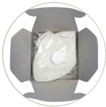
Mascherine blisterate singolarmente