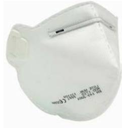
MASCH-01 • TIPO FFP1 • MASSIMO LIVELLO D'USO: 4 x TLV • SENZA VALVOLA DI ESALAZIONE