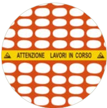
Banda di segnalazione