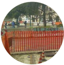
Esempio di utilizzo della recinzione cantiere