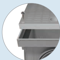
Compatibile con il pozzetto "SUPER" a pag.10