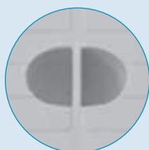
Elemento di presa del chiusino