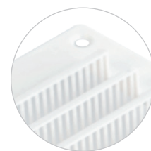
Fori per il passaggio dell'aria